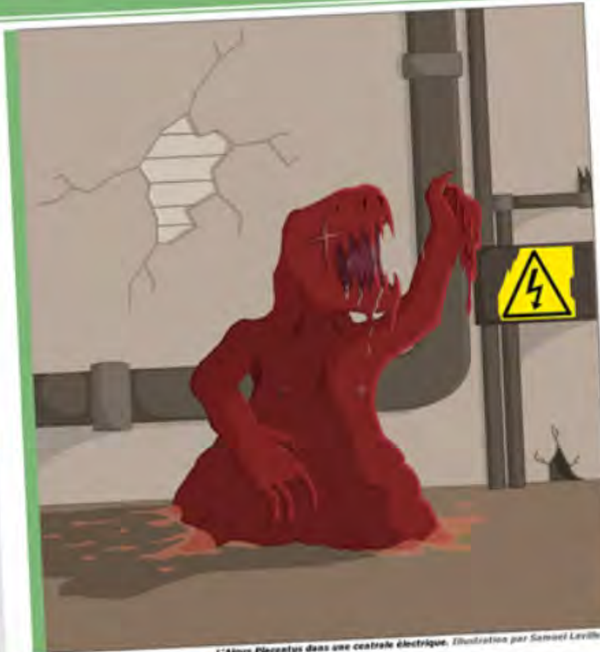
L'Algas Placentus dans une centrale électrique. Illustration par Samuel Laville